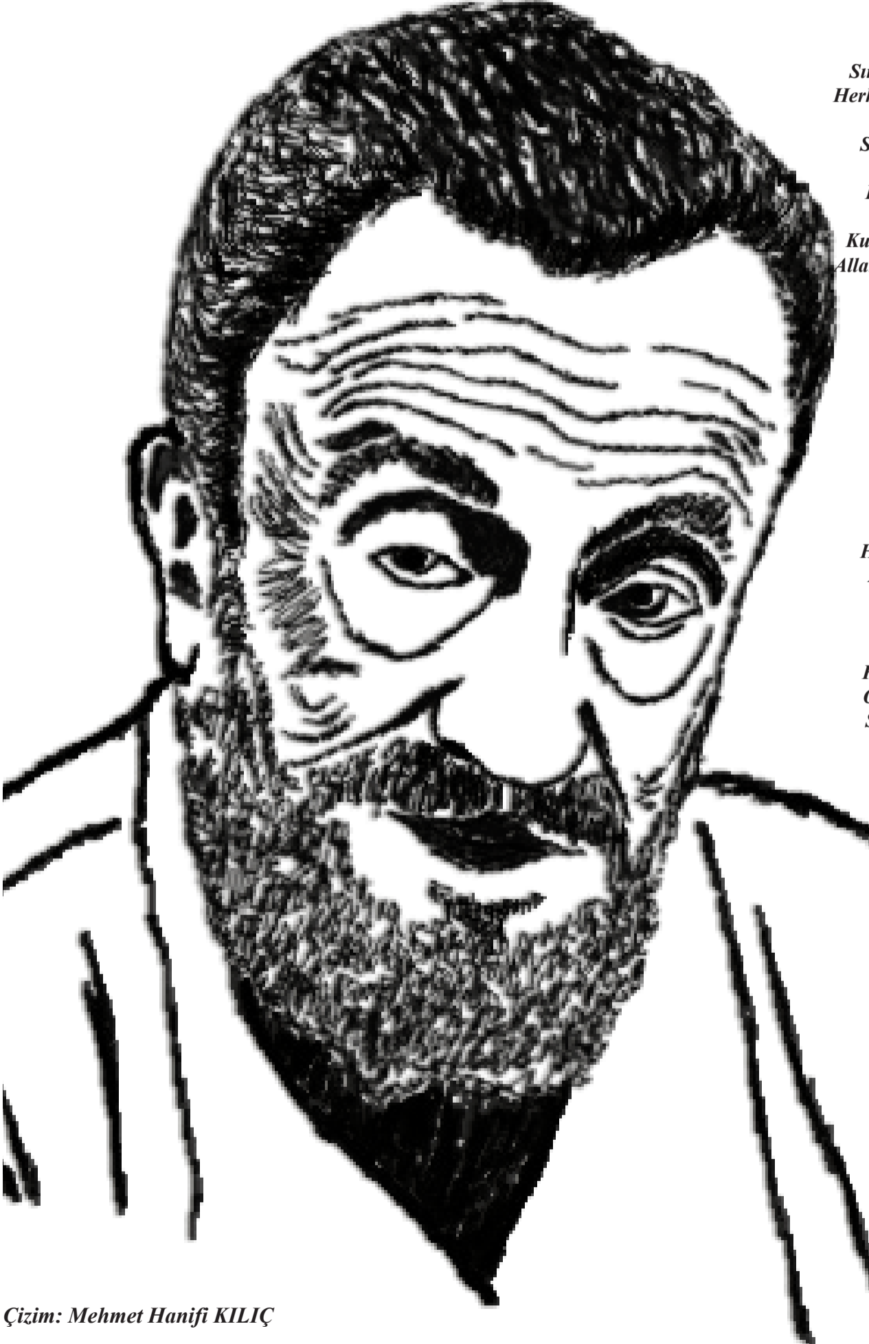
Çizim: Mehmet Hanifi KILIÇ

Sırtımı uykuda dürtüyor bir el; Fırla yatağından koşar adım gel! O bir minicik zar, kabuğunu del! Seni çağıran var, tâ maverâdan!